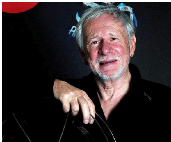
réalisation : Jean-François Laguionie