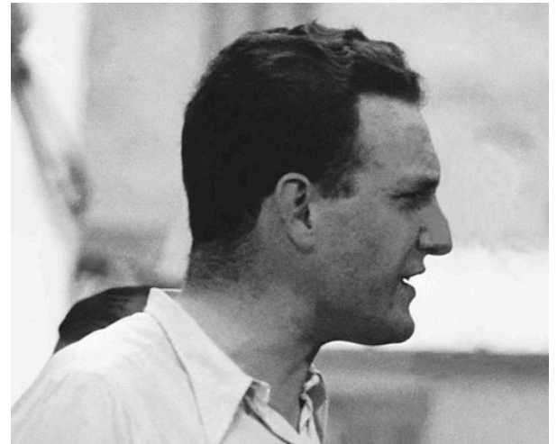
réalisation : Jean Grémillon