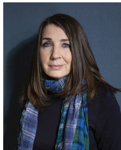
réalisation : Anca Damian